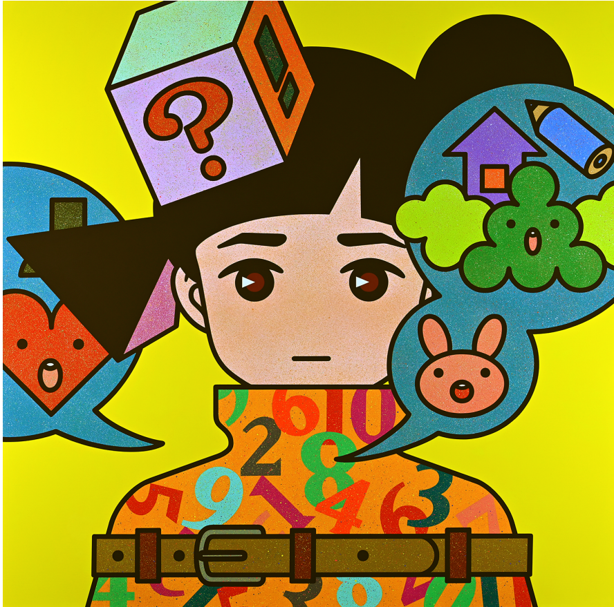
Who am I , 2023, acrylic on canvas, 116.7 by 116.7 cm.

Opening Reception: Friday, 19 May 2023, 5 - 8 pm (Artist will be present)