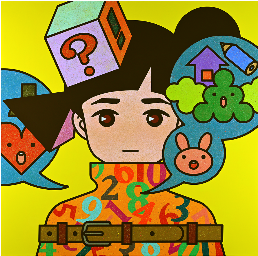
「Who am I」、2023、アクリル絵の具、116.7 x 116.7 cm。

オープニングレセプション 2023年5月19日(金)17時～20時 (アーティスト在廊予定)