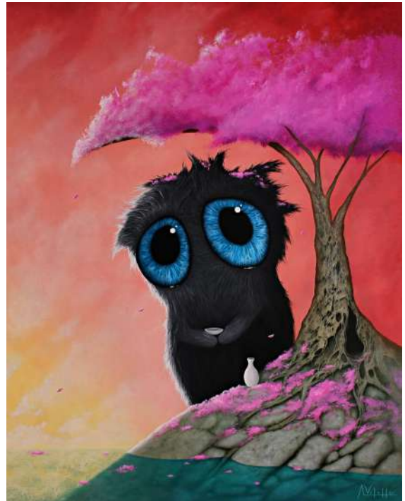
August Vilella, Book Writer , 2024. Oil on canvas, 81 by 100 cm © Courtesy of the artist and JPS Gallery

August Vilella's boundary-blurring artistry is set to become a highlight of the Tokyo art scene, attracting a diverse audience from seasoned collectors to curious newcomers. The "Seasons" exhibition promises not only to deepen appreciation for Vilella's work but also to renew visitors' sense of wonder about the world around them.