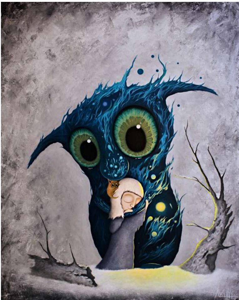
August Vilella, Winter Hug , 2024. Oil on canvas, 100 by 81 cm