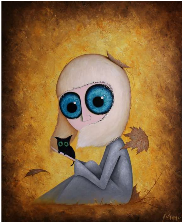
August Vilella, Autumn Meeting , 2024. Oil on canvas, 100 by 81 cm © Courtesy of the artist and JPS Gallery

In a whimsical fusion of dream and reality, the prestigious Ginza Six in Tokyo is set to transform into a portal of fantastical artistry this September. Acclaimed artist August Vilella will be exhibiting his mesmerising solo exhibition, "Seasons," in the heart of Japan's capital, where every work tells a story and every moment is an opportunity for discovery.