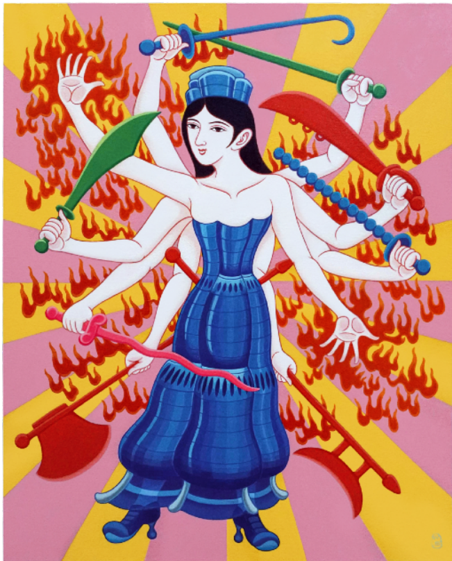
石家豪，《Goddess of Plastic Blades 膠劍女神》，2025，塑膠彩畫布，75 x 60 厘米