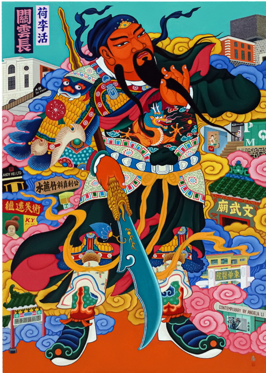
石家豪，《General Guan Yu on Hollywood Road (April 2024 version) 荷李活關雲長（甲辰年二月版）》，2024，油彩畫布，140 x 100 厘米