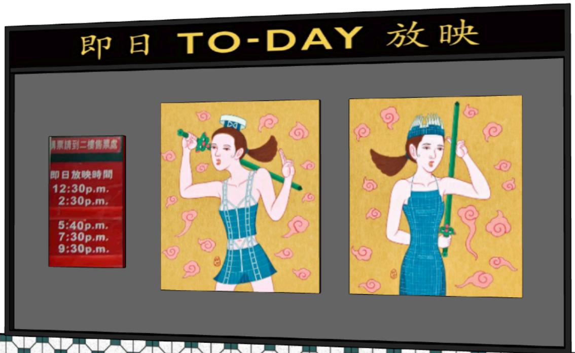
展覽效果圖（僅供參考）