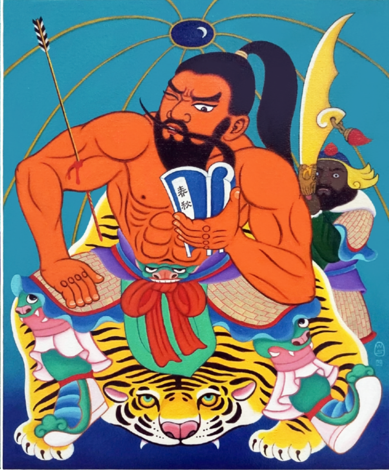
石家豪，《The Tears of Guan Yu 關公哭》（左）和《The Hurt of Guan Yu 關公傷》（右），2025，油彩畫布，50 x 40 厘米