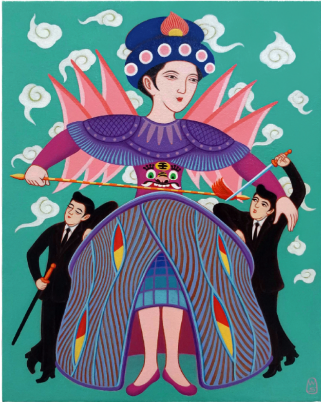
石家豪，《Xiqu Centre 戲曲中心》， 2025，塑膠彩畫布，50 x 40 厘米 © 圖片由藝術家和IPS畫廊提供。