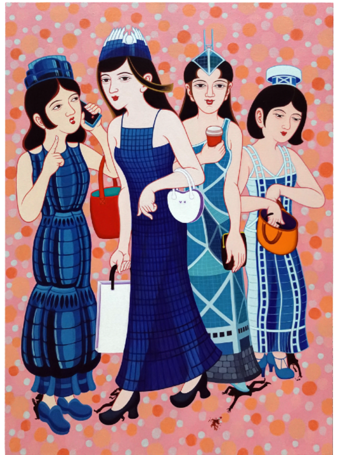
石家豪，《WWIV 第四次世界大戰》，2025，塑膠彩畫布， 140 x 100 厘米 © 圖片由藝術家和JPS畫廊提供。

石家豪以幽默而富創意的方式，將傳統與藝術趣味結合，不僅為這個繁榮的都市添上新意，也在傳統與當代之間注入玩味色彩，為日常生活增添趣味與欣賞價值。「關公大戰石家豪」，誰勝誰負，有請觀眾拭目以待，入場觀看便自有分曉。