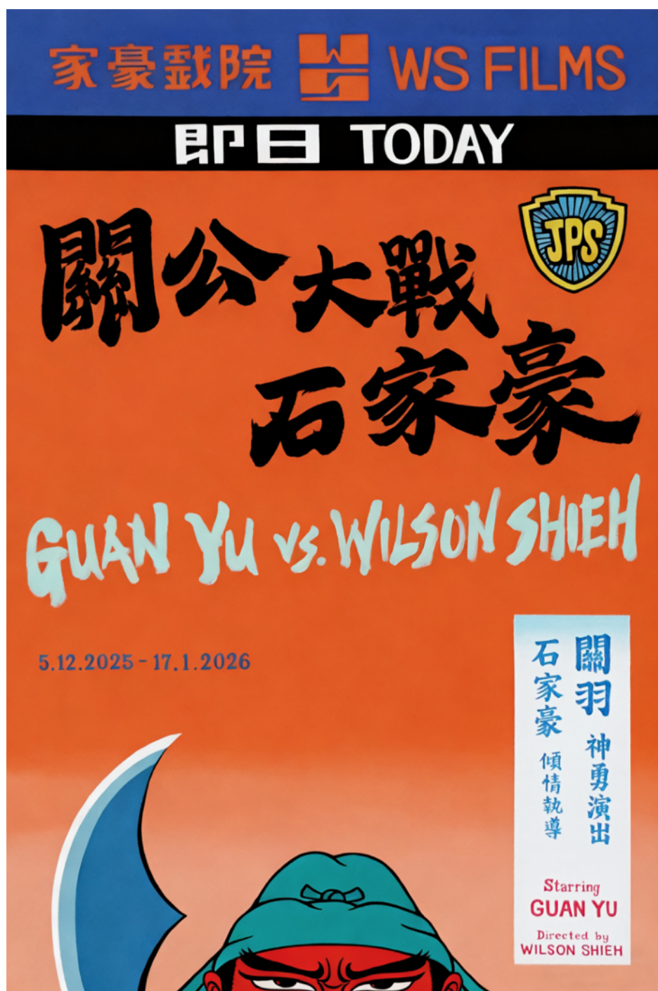
石家豪，《Guan Yu vs. Wilson Shieh (Poster) 關公大戰石家豪（海報）》，2025， 塑膠彩畫布，90 x 60 厘米