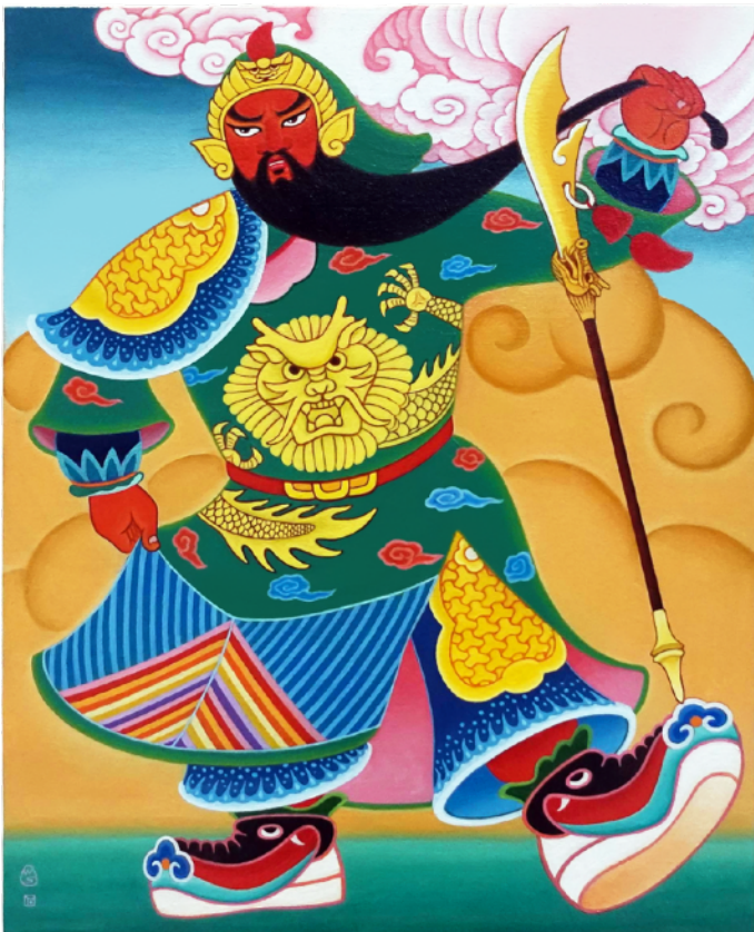
石家豪，《The Cut of Guan Yu 關公斷》，2025，油彩畫布，50 x 40 厘米

為了讓觀眾更投入這場決戰的體驗，展覽把昔日的香港戲院重現，並精心製作一齣人工智能(AI)技術電影，把畫中的武士更鮮明地活現眼前。一場跨越古今界限，展現歷史與現代文化的戰鬥，「關公大戰石家豪」即將隆重獻映。